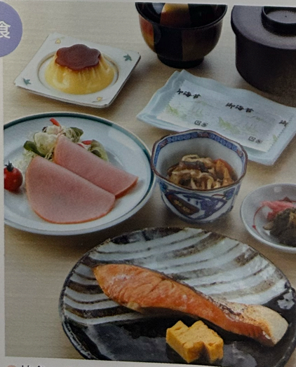
● 焼魚 ● 出し巻き玉子