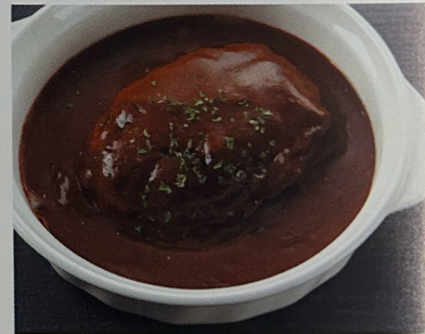
煮込みハンバーグ